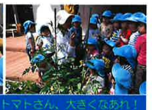
トマトさん、大きくなあれ!