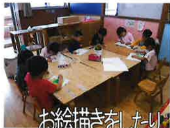
お絵描きをしたり、折り紙で遊んだよ~♪