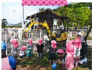
★エンボかっこいいね★