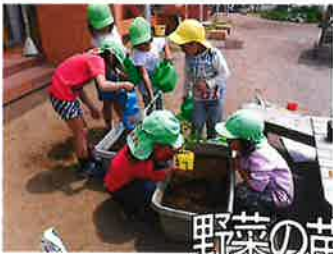
野菜の苗を植えたよ~♪