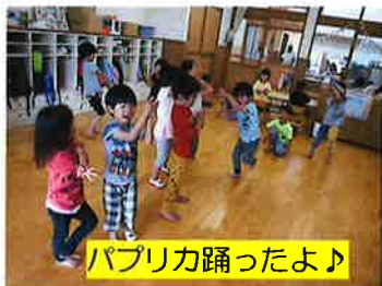
パブリカ踊ったよ♪