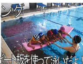
カニさんになって泳いだよ! ヒート板を使って泳げよ!