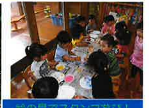
絵の具でスタンプ遊び!