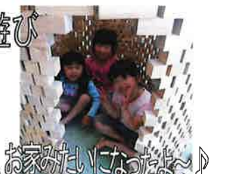
積み木をたくさん積み上げて、お家みたいになったよ~♪