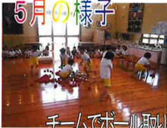
チームでボール取りゲームをしたり、二人組でボールを投げ合ったりしたよ!