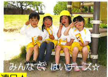
みんなで、はいチーズ☆