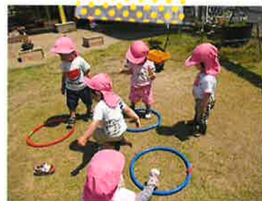
★フープの中に〜びよん!★