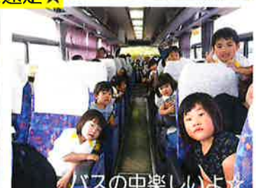
バスの中楽しいよ☆